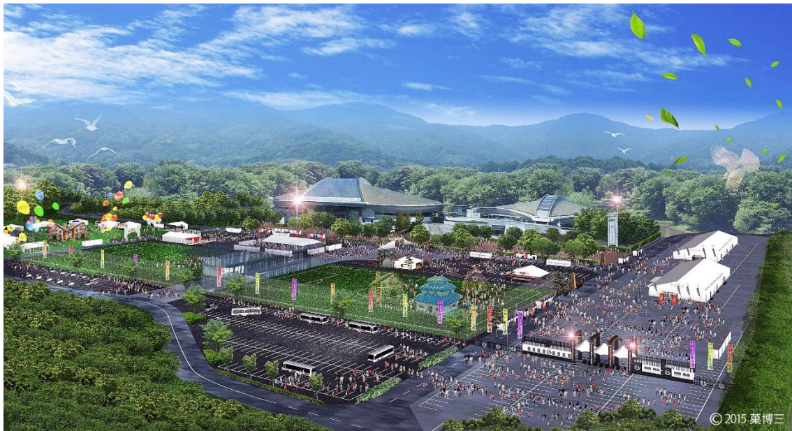
(県営サンアリーナ周辺)